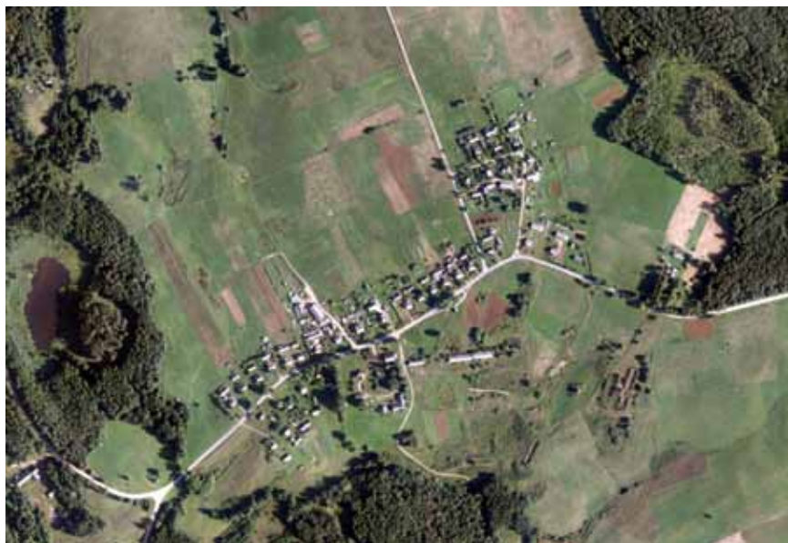
Kumpuolių gyvenvietė. 2013 m.