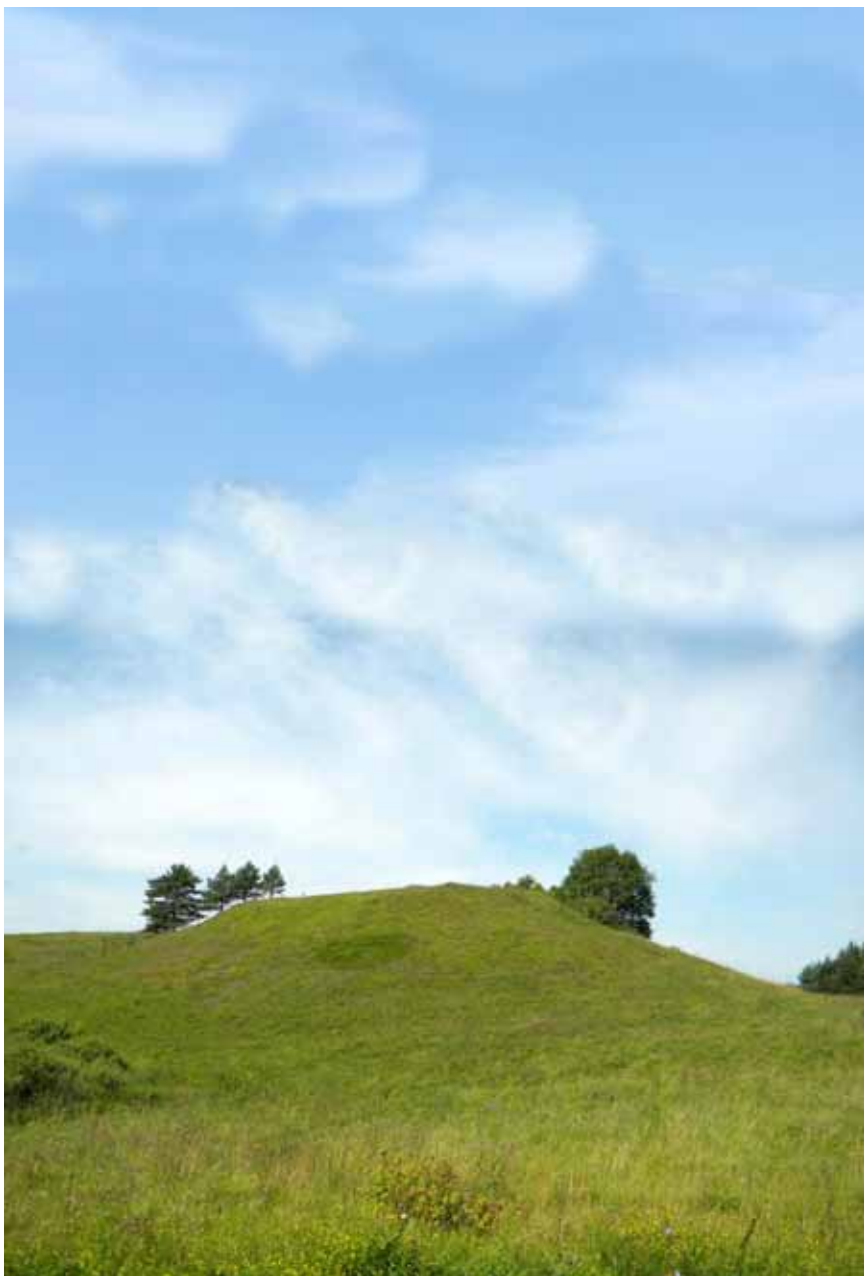
Maniuliškių piliakalnis.