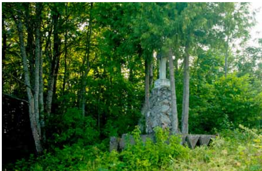
Ajočių kryžius 2014 m.

Ajočių kaimo ulyčia išdalinta į vienkiemius 1909 m. Devyniuose valakuose išsistatė 32 sodybos. Žmonės iki dabar pasakoja, kad kam kur keltis iš ulyčios paaiškėjo burtų keliu. Gyventojai sutarė: sužymėti sklypus,