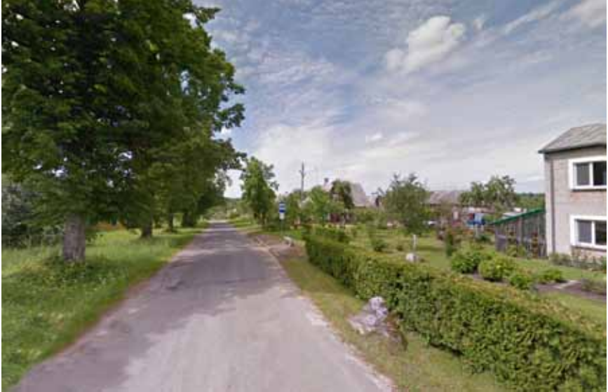
Kumpuoliai. 2012 m.