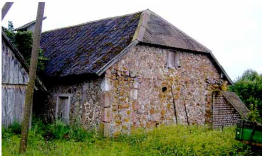
Svirnas. 2014 m.

Medinės architektūros gyvenamasis dvaro namas – išlikęs iki šių dienų, pastatytas 1913 m. medinis, šiuolaikiškos statybos namas. Gražūs tašytų akmenų namo pamatai, yra rūšys. Name buvo keli erdvūs kambariai, didžiulė virtuvė, laiptai į antrą aukštą. Nacionalizavus dvaro sodybą namo paskirtis buvo labai įvairi. Šiandien čia gyvena kelios skirtingos šeimos.