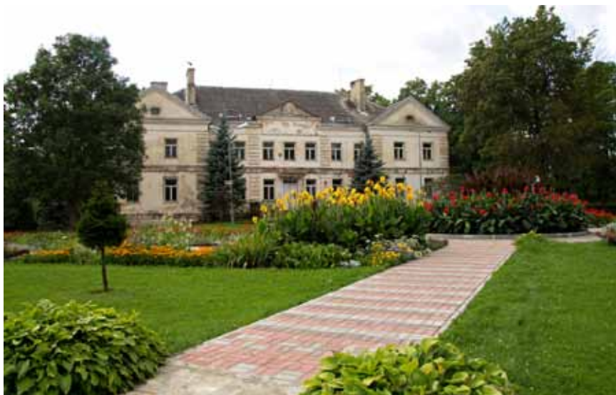
Antazavės dvaro rūmai.

Vis mes esam tolimesni ar artimesni giminės - ketvirtos ar penktos eilės pusbroliai ir pusseserės. Jau prieš 150 metų Streikai ėmė Streikutes, Abarytės tekėdavo už Abarių. Senosios - pagrindinės pavardės tarpusavyje susimaišę: Turkai su Urviniais, Bareikais, Streikais. Streikai su Mikitomis, Abariais ir t.t. Iš senųjų bažnytinių knygų galima spręsti, kad Jonišio, Ajočių Streikai bei Abariai yra gimę ar gyvenę Maniuliškėse ar atvirksčiai. Baudžiamos laikais pono valia buvo spręsti, kur kam gyventi, ypač jei kaime atsirasdavo tuščia sodyba, šeimai išmirus ar nusigyvenus. Tie trys kaimai priklausė Kumpuolių dvarui, todėl jų gyventojai keitėsi marčiomis ir jaunikiais.