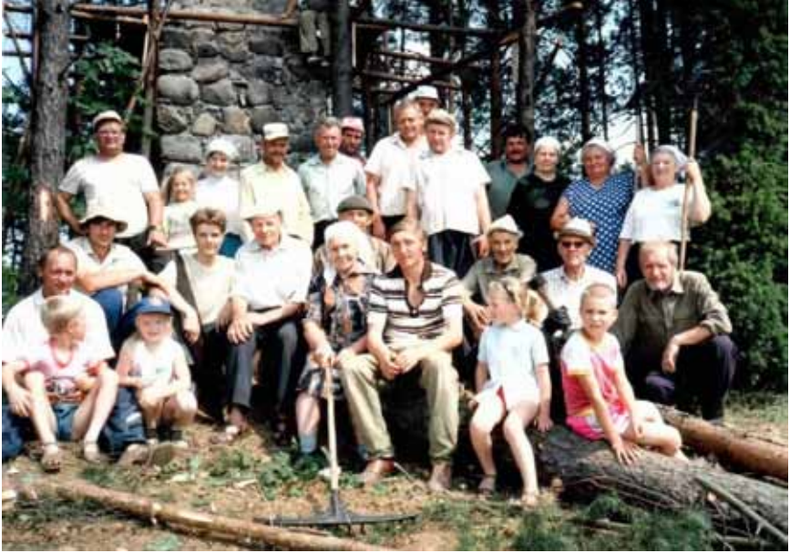
Koplytėlės atstatymo ir kapinių sutvarkymo talkininkai 1994 m.