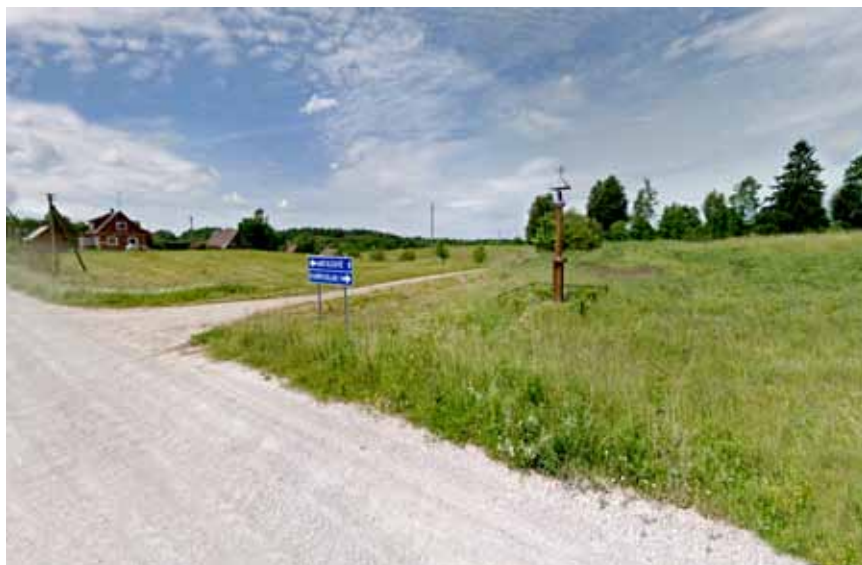
Maniuliškių sankryža. 2012 m.

1703 m. ir 1715 m. Kriaunų bažnyčios archyvo knygosė dar žymima Suvieko parapija. Suviekas kaip parapija sunyko apie 1750 m., nors yra išlikusi Suvieko parapijos krikštų ir jungtūvių registracijos 1749 - 1767 m. knyga.