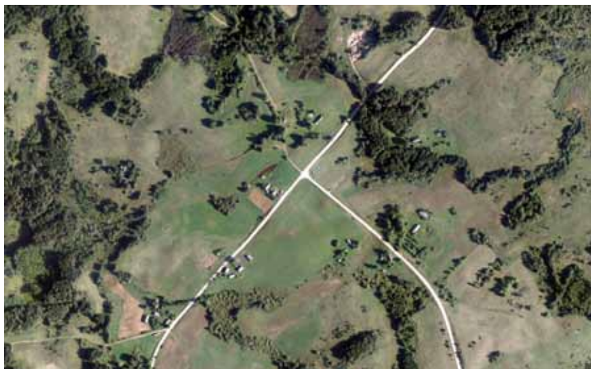
Maniuliškių kaimas 2012 m.

įtrauks. Prisimena dažnai pasakoti du atsitikimai, tik prisimiršo pavardės. Ėjo pulkas bernų ar ne į Ajočius. Priėjo stirtą kūlelių. Vieną kūlelį pažastin, kitą, o kieno rankos ilgesnės, tas pasispaudė tris. Eidami pakeliui išdėliojo tuos kūlelius nemažais tarpais. Ir susirink, kad geras! Buvo kaime nelabai turtingas, bet mėgstantis truputį pasipuikuoti ūkininkas. Laikė tas ūkininkas kumelį, tik nelabai turėjo kuo šerti. Bet kam einant pro tvartą, nuolat žvengdavo. Ką čia, girdi, kumelį pusbadžiu laiko. Reikia jį vienąkart pašerti. Ir vyrų pulkas sulindo daržinėn. Vieną kartą nuneša po glėbį, antrą kartą, tvartas jau prikimštas šieno, o daržinėj jo ne kiek ir belikę.