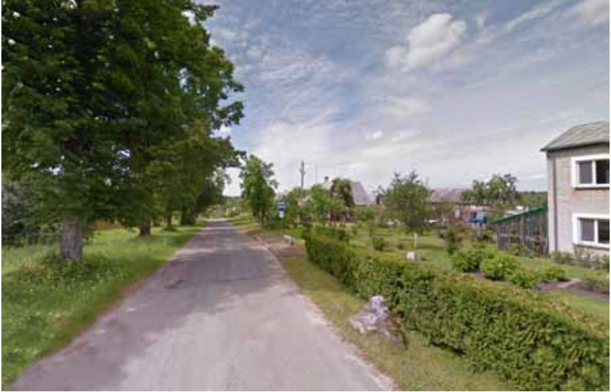
Kumpuoliai. 2012 m.